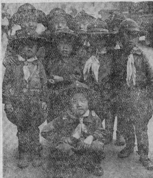
Estos niños que nos muestra el presente grabado, se preparan desde hoy para hacer frente a cualquier emergencia en el mañana. Parece prematuro, pero es que al paso que van las cosas, la guerra la decidirán los que aún ni siquiera han nacido.

Amoldarse. — Allanarse, acomodarse, adaptarse, conformarse, avenirse, ajustarse.